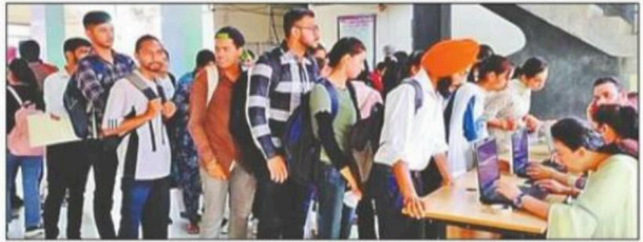
रोजगार मेले में पहुंचे प्रतिभागी।