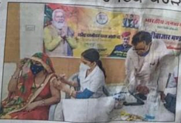
ਪ੍ਰਧਾਨ ਮੰਤਰੀ ਨਰਿੰਦ ਮੋਦੀ ਦੇ ਜਨਮ ਦਿਨ 'ਤੇ ਚੌਥੀ ਵਾਰ ਇਕ ਦਿਨ 'ਚ ਇਕ ਕਰੋੜ ਤੋਂ ਵੱਧ ਟੀਕੇ ਲਗਾਏ ਗਏ।

ਨਵੀਂ ਦਿੱਲੀ, 17 ਸਤੰਬਰ : ਭਾਰਤ ਨੇ ਸ਼ੁਕਰਵਾਰ ਨੂੰ ਇਕ ਦਿਨ ਵਿਚ 2 ਕਰੋੜ ਤੋਂ ਵੱਧ ਕੋਵਿਡ ਵਿਰੋਧੀ ਟੀਕੇ ਲਗਾ ਕੇ ਰੀਕਾਰਡ ਬਣਾਇਆ। ਇਹ ਸਫ਼ਰਾ ਅੱਜ ਪ੍ਰਧਾਨ ਮੰਤਰੀ ਨਰਿੰਦ ਮੋਦੀ ਦੇ ਜਨਮਦਿਨ 'ਤੇ ਟੀਕਾਕਰਨ ਦੀ ਮੁਹਿੰਮ ਦੁਆਰਾ ਪ੍ਰਾਪਤ ਕੀਤੀ ਗਈ। ਕੋ-ਵਿਨ ਪੈਨਟ ਪ੍ਰੋਗਰਾਮ ਅੰਗਰੇਜ਼ੀ ਅਨੁਸਾਰ ਸਮ 5.10 ਵਜੇ ਤਕ ਦੇਸ਼ ਭਰ ਵਿਚ 2 ਕੋਰੋਨਾ (ਐਟੀ-ਕੋਵਿਡ ਟੀਕਾ) ਲਗਾਏ ਗਏ। ਦੇਸ਼ ਭਰ ਹੁਣ ਤਕ ਕੁਲ 78.68 ਕਰੋੜ ਟੀਕੇ ਲਗਾਏ ਜਾ ਚੁੱਕੇ ਹਨ। ਇਕ ਮਿੰਟ ਤੋਂ ਵੀ ਘੱਟ ਸਮੇਂ ਵਿਚ ਚੌਥੀ ਵਾਰ, ਇਕ ਦਿਨ 'ਚ ਇਕ ਕਰੋੜ ਤੋਂ ਵੱਧ ਟੀਕੇ ਲਗਾਏ ਗਏ।